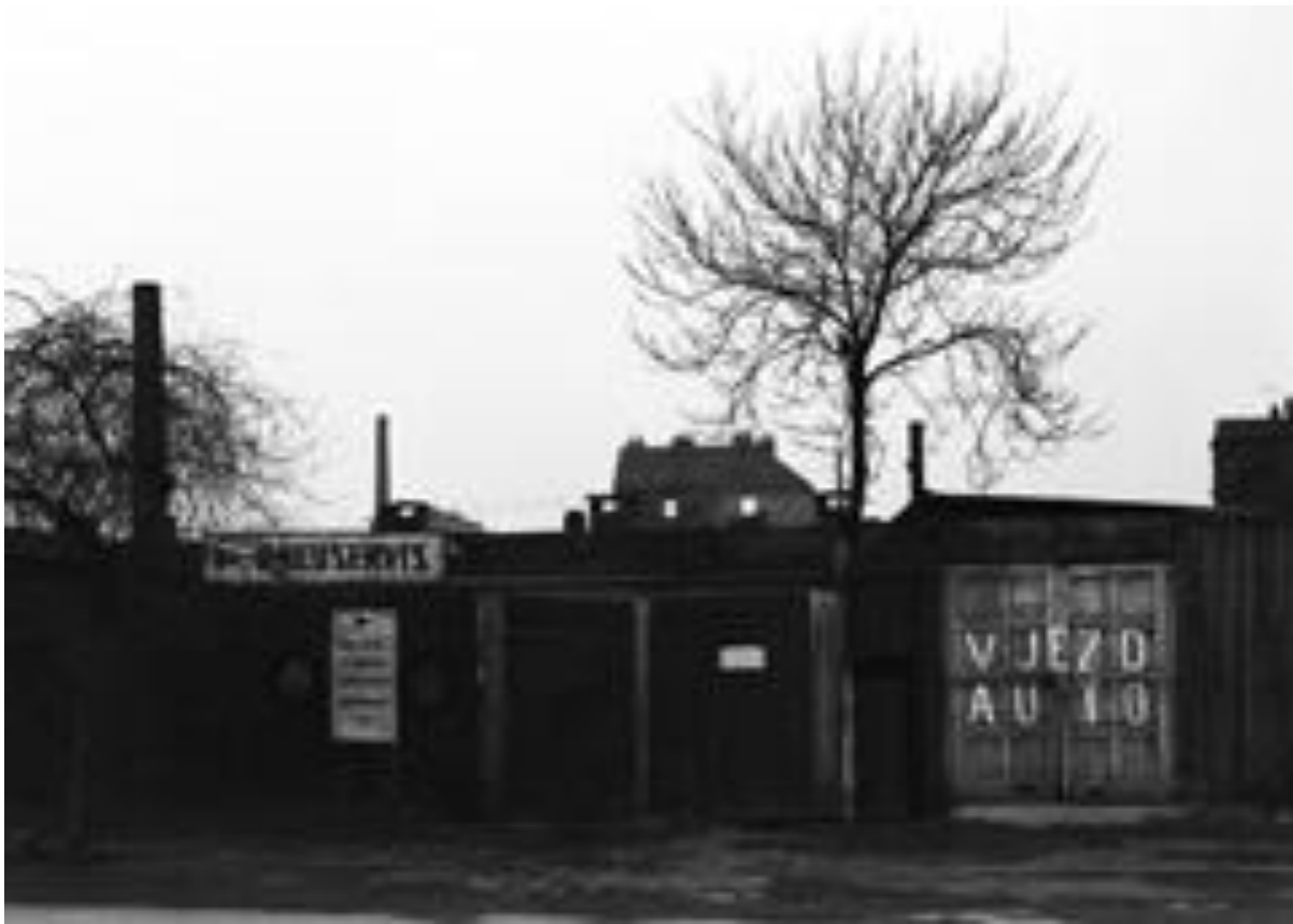
Holešovice – Na Maninách