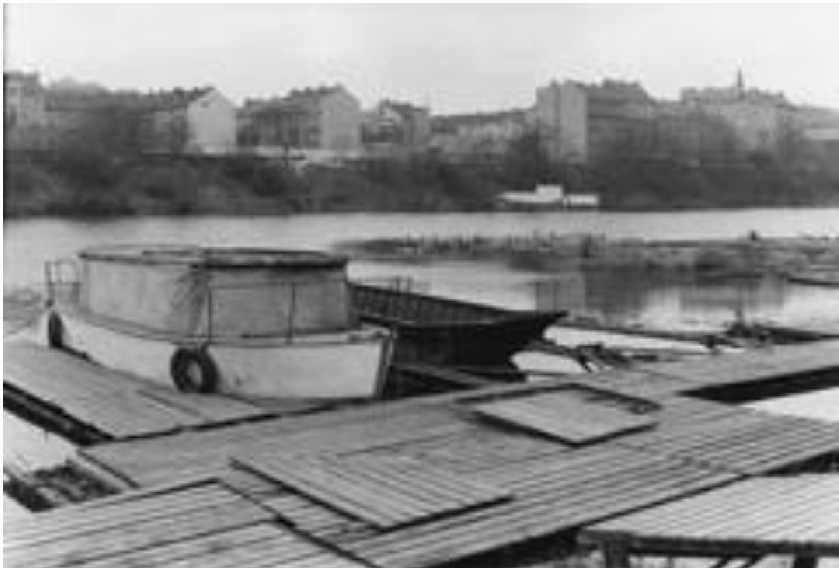
Smíchov – přístav

Josef Kroutvor, 2000 Translation into English: Barbara Day