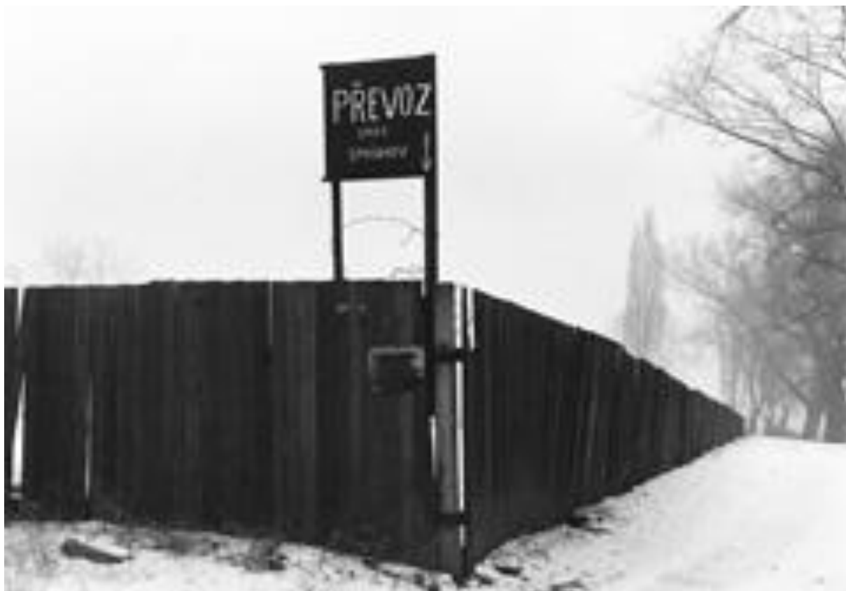
Na Císařské louce