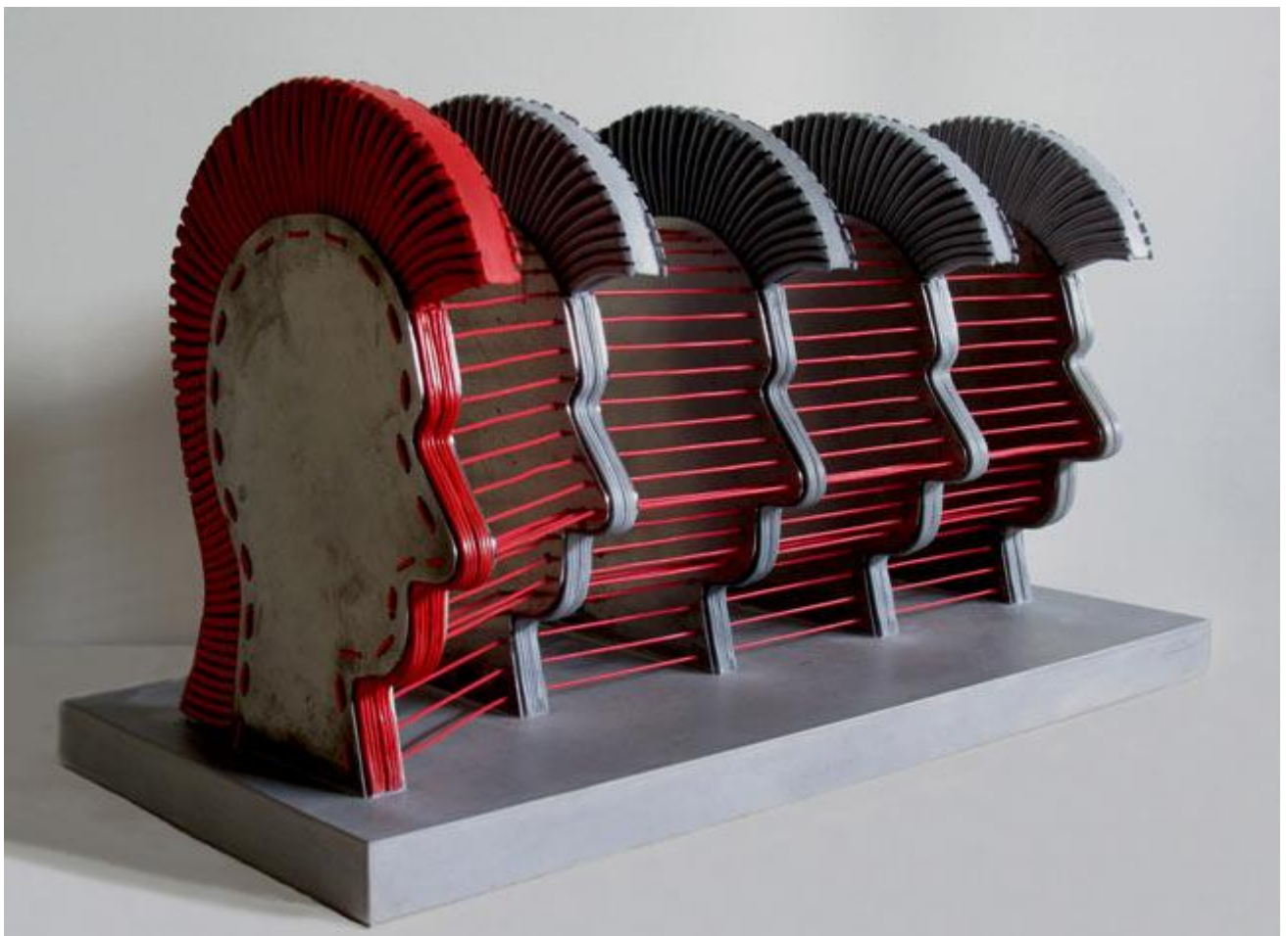
HOUPACÍ KONĚ, 2015 acrystal; 65,5 x 30 x 35 cm

Martina Hozová po trubkovém období, kterému dominovaly Fontány a trojice Homo Devil , Homo Saint a Homo User , převtěřila své téma do generační otázky a generační obavy. Po Husákových dětech přišly Havlovy děti, říká se jim děti milénia nebo iGen, protože nedají ani ránu bez iPadů a iPhoneů. I to by mohla být Cable generation . Reliéf Neun glückliche Schlauchtüllmensen in Abzweigdosen je možno vnímat jako dystopický Matrix nebo vyjádření Urban Tribe, městského kmene. Existují společenské, sociologické i PR a marketingové studie o rozdílu mezi poválečnými generacemi. O jejich vztahu k době, penězům, práci, technologiím, rodině... Po Generaci Baby Boomu přicházejí písmenka X, Y, Z a možná se již rodí nový cyklus, Generace Alfa.