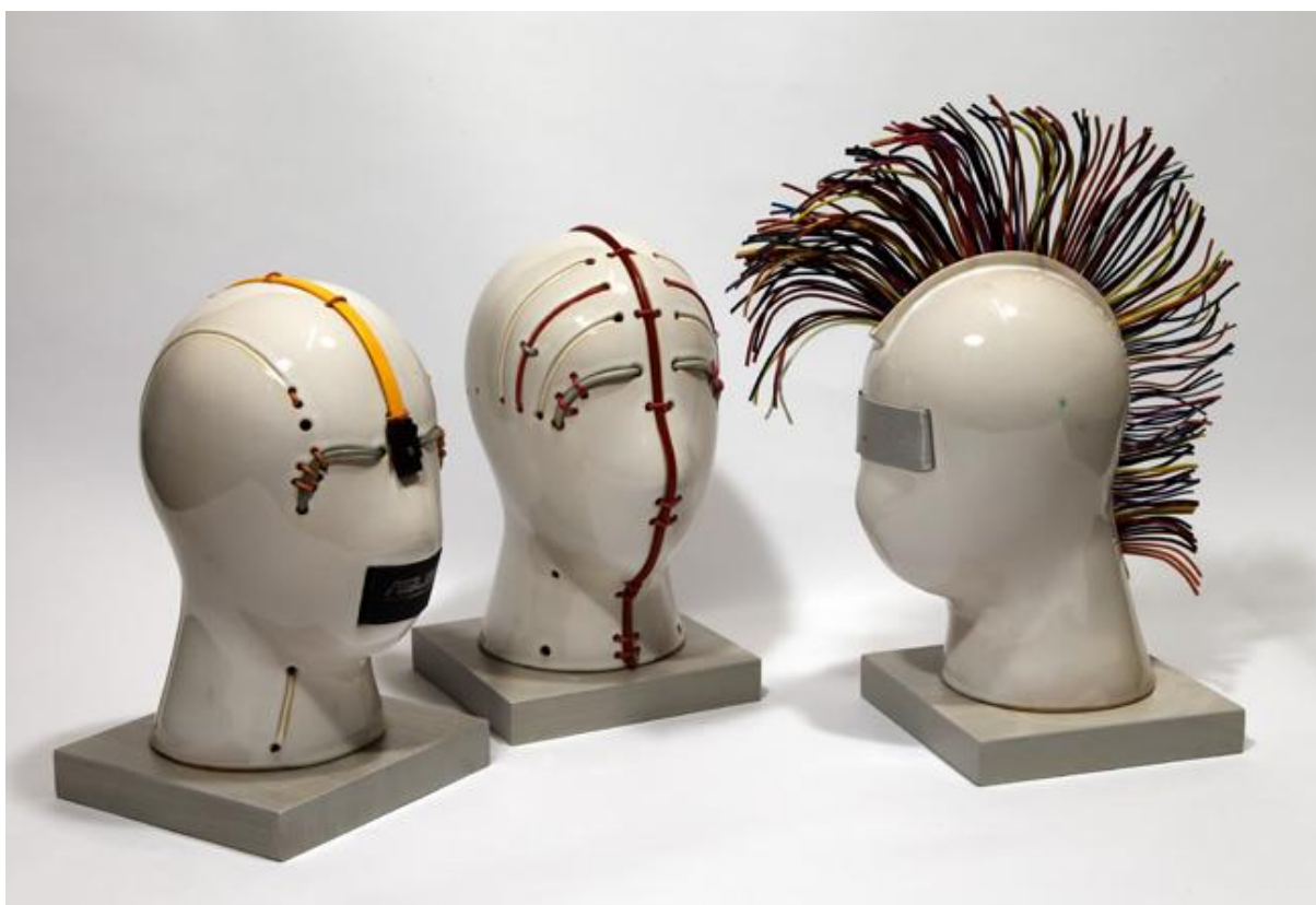
CABLE GENERATION, 2016 keramika; výška 28 cm

2016 – 2017 – Realizace pomníku Žofie Chotkové pro Prahu 6, 2014 – 2015 – Kopie renesančních alabastrových reliéfů pro kostel Sv. Floriána v krásném Březně, 2013 – Rekonstrukce sochy Austrie pro pomník Baterie mrtvých na Chlumu u Hradce Králové, 2010 - Rekonstrukce chybějících barokních váz pro sousoší Sv. Antonína Paduánského z Karlova mostu v Praze, 2006 – Rekonstrukce Vrtbovské zahrady v Praze - vytvoření kopie sochy Diany podle originálu M. B. Brauna z pirnského pískovce atd.