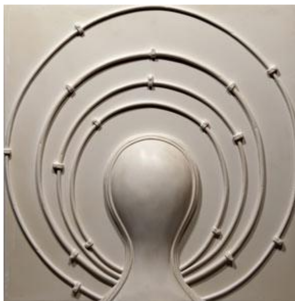
AURA V, 2016 acryl 50 x 50 cm

V aktuální práci rozvíjí téma seriality, jež známe už z Myší a reliéfů Connecting people . Pro získávání informací není potřebná mobilita, ale propojenost. Od sloganu Connecting people v době migrační krize upustila i Nokie, jako bychom už se nechtěli propojovat. Přestože sdílení, tzv. participace je nejfrekventovanějším slovem posledních let. Je v tom jisté pokrytectví doby: na síti virtuálně sdílíme názory, obrázky, vtípky a kritické hodnoty, ale ve skutečném životě jsme individuálové, kteří nikomu nedůvěřují a udržují si odstup.