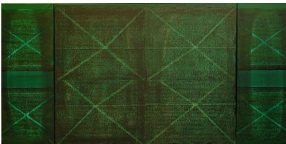
EPITAF IV, 2010 akryl, olej na plátně, 160 x 80 cm