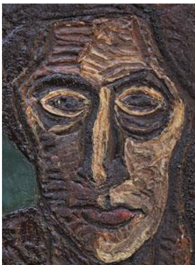
Neznámá žena II. – detail, 1963 akronex a syntetické barvy na plátně