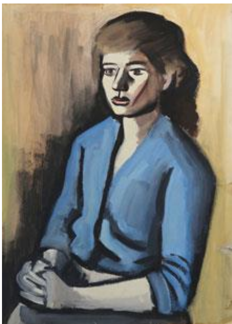
Marie Matznerová tempera na papíře; 64 x 87,5 cm