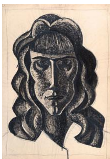
Neznámá žena I. lavírovaná kresba tuší na papíře 45 x 63 cm