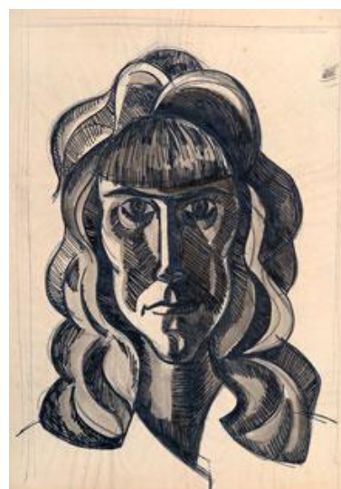
Neznámá žena I. lavírovaná kresba tuší na papíře 45 x 63 cm