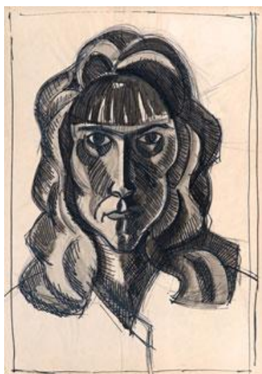
Neznámá žena I. lavírovaná kresba tuší na papíře 45 x 63 cm