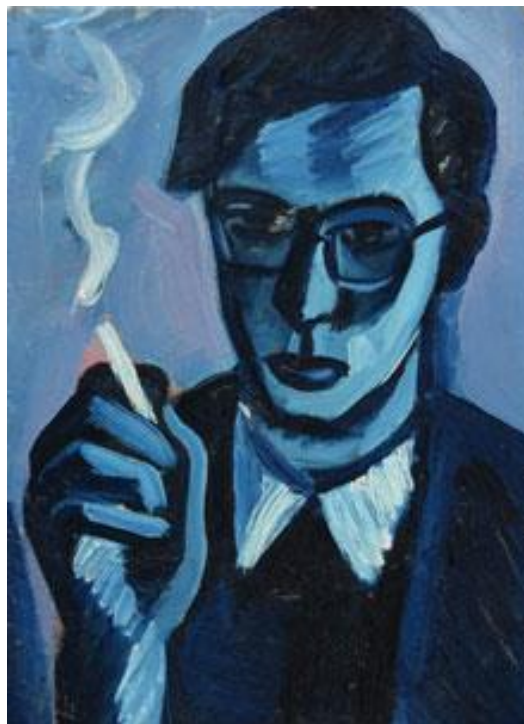
Miloš Vodička olej na kartonu; 34,5 x 47,5 cm