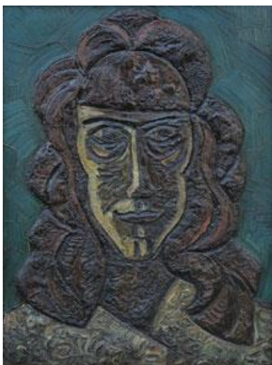
Neznámá žena I., 1963 akronex a syntetické barvy na sololitu 46 x 61 cm