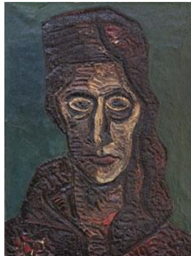
Neznámá žena II., 1963 akronex a syntetické barvy na plátně 39 x 53 cm