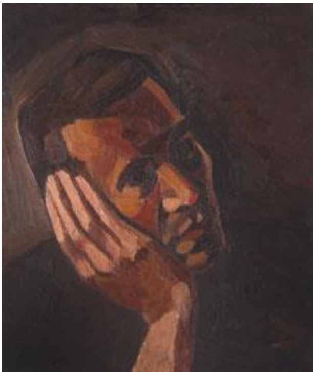
Václav Novák olej na překližce; 36,5 x 43,5 cm