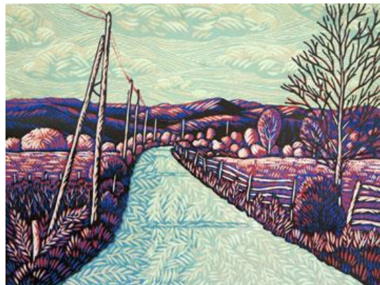
Malá cesta v Limuzínsku

A jestli toho chcete vědět víc, tak se můžete podívat na mé stránky a tam bude něco o mých proběhlých, i budoucích výstavách a je tam i plno různých fotografií: