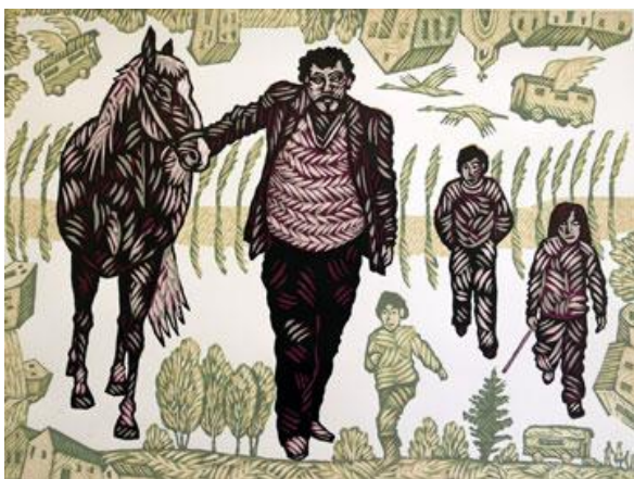
Volný jako vítr