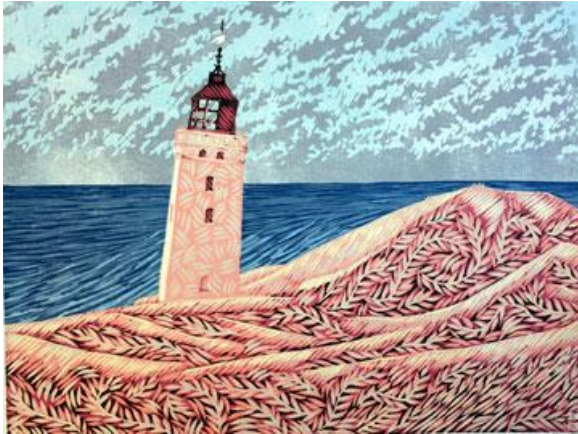
Maják Ryuge Kunde (Dánsko)