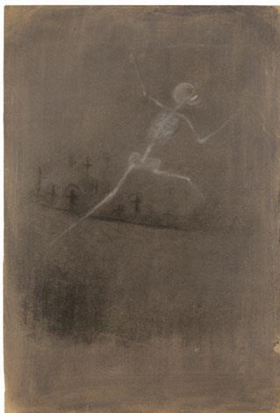
K. J. Erben: Svatební košile, 50. léta

Většina jeho obrazů vámi otřese, a vezme vám tento otřes chvíli času, než začnete přemýšlet. A jakmile začnete, jste nuceni jít velmi, velmi daleko, do zvláštních představ, do zvláštního světa, cizího, nepokojného, rozrušujícího, temného, záhadného. Ptal jsem se často Diviše, zdali se nebojí spát se svými obrazy. Zdá se, že se nebál, že vydržel chodit kolem jednoho plátna hodiny, dny, snad i měsíce. „Je to špatné, musím to celé předělat“ – byl jeho konečný úsudek.