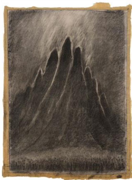
Bible, druhá kniha Mojžíšova, 50. léta