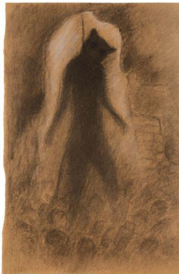
E. A. Poe: Černý kocour, 50. léta

Diviš maloval v noci. Dopoledne vyřizoval různé věci, šepsoval, kreslil si na malé papírky u psacího stolku, na kterém měl vždycky kytičku od přátel. Když jsem přišla někdy odpoledne, stál u štafle s obrazem, ale hned práce nechal – říkal, že se na práci soustředí až v noci. Večer odcházel, ale v jeho tehdejších dopisech čtu. „Přijď po osmé, to už budu doma.“ Chodil na večeri a pak maloval, jak říkal, do čtyř hodin do rána.