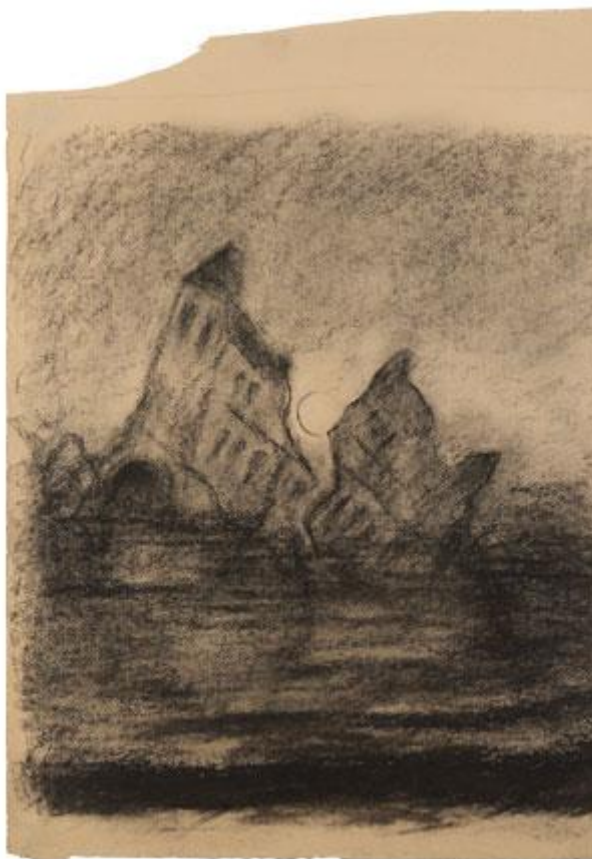
E. A. Poe: Zánik domu Usherů, 50. léta