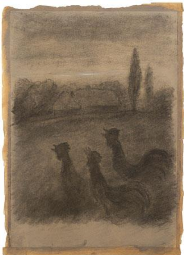
K. J. Erben: Svatební košile, 50. léta