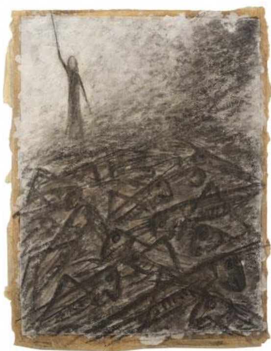
Bible, druhá kniha Mojžíšova, 50. léta