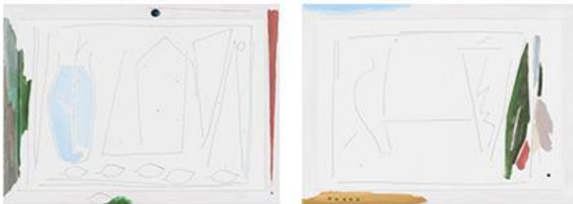
Kresby, 2017 – 18 papír, tužka, olej, dřevěný rám, sklo; 23,5 x 32 cm