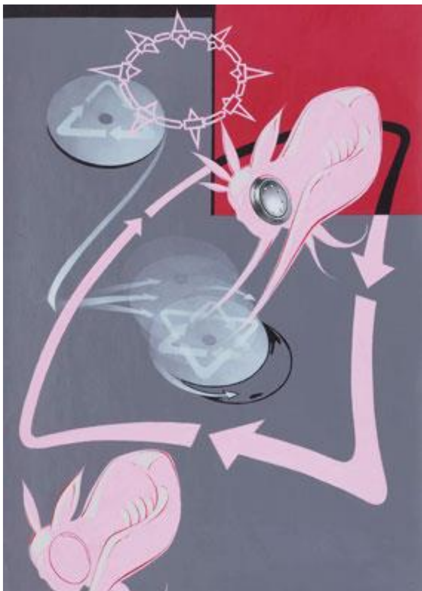
Jaroslav Schejbal - Scratching - Retro - Story