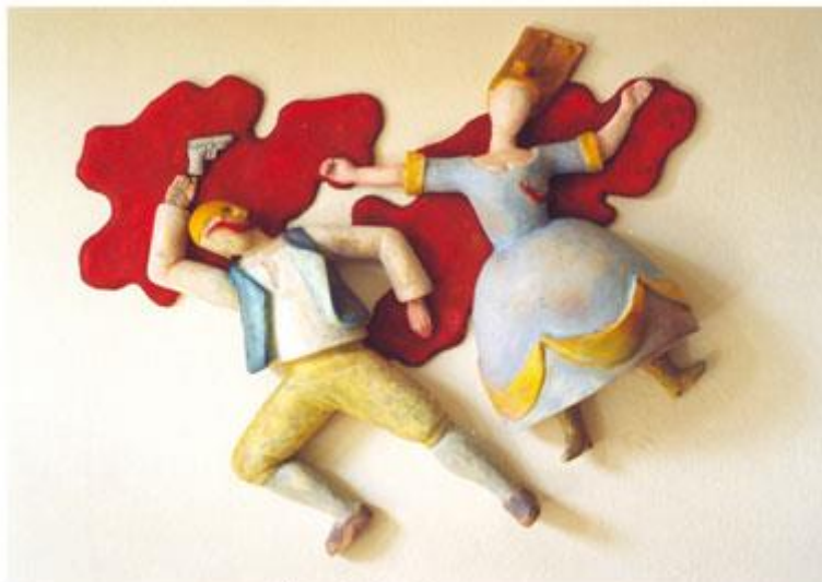
Pohádka, 2002, 15x80x50cm, epoxy Fairy-tale, 2002, 15x80x50cm, epoxy