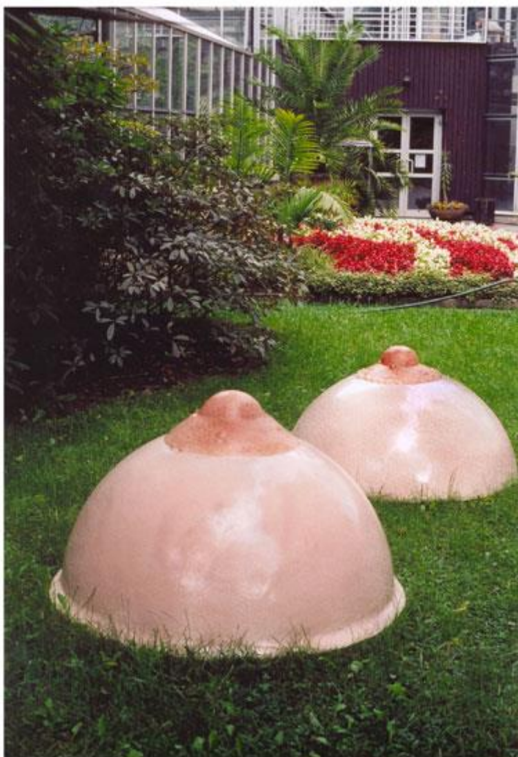
Centra , 2004, 2x cca60x100x100cm, polyester, (výstava v Botanické zahradě v Praze) Centres , 2004, 2x cca60x100x100cm, polyester, (exhibition in Botanical garden in Prag)