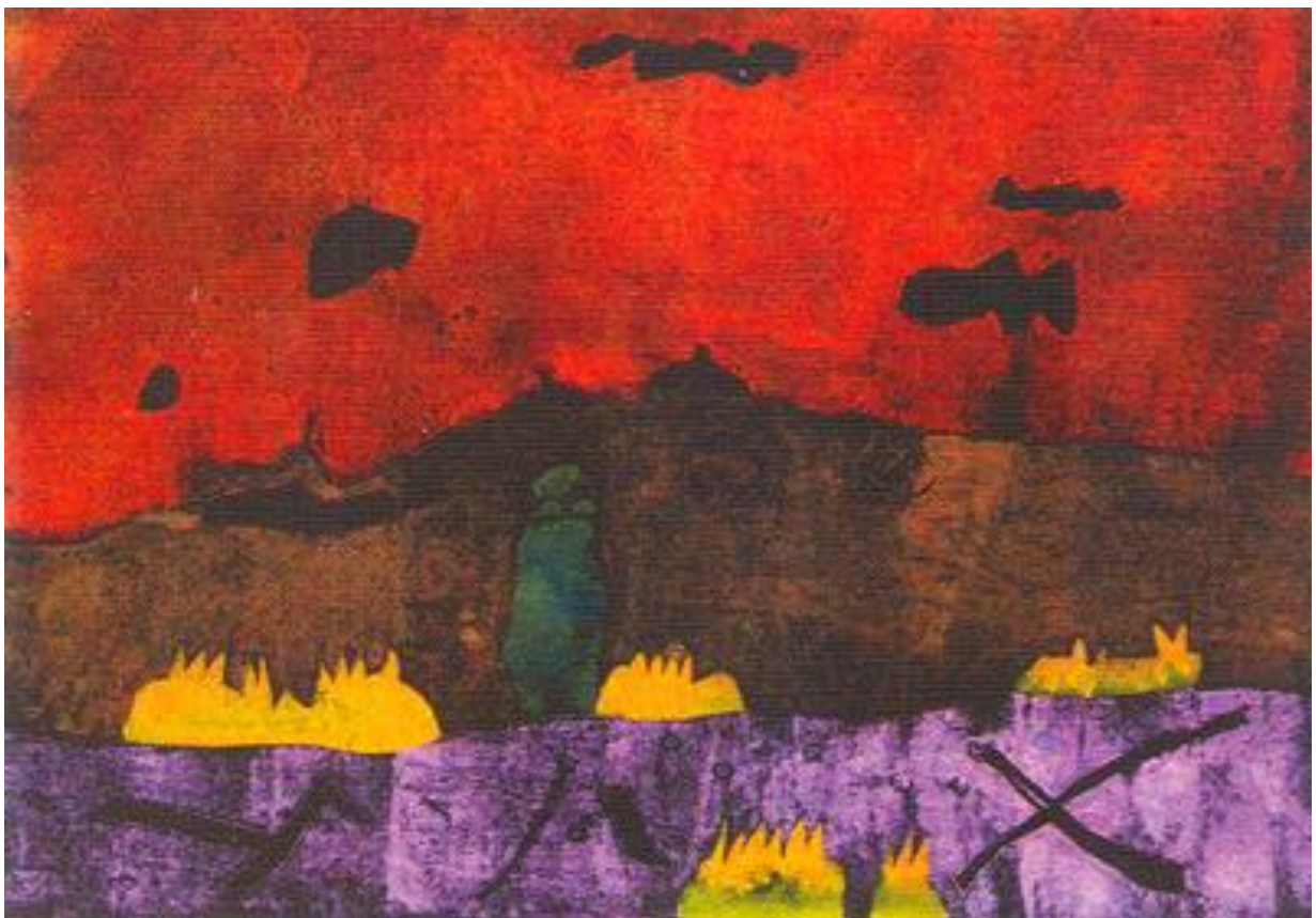
Idol v krajině, 1985