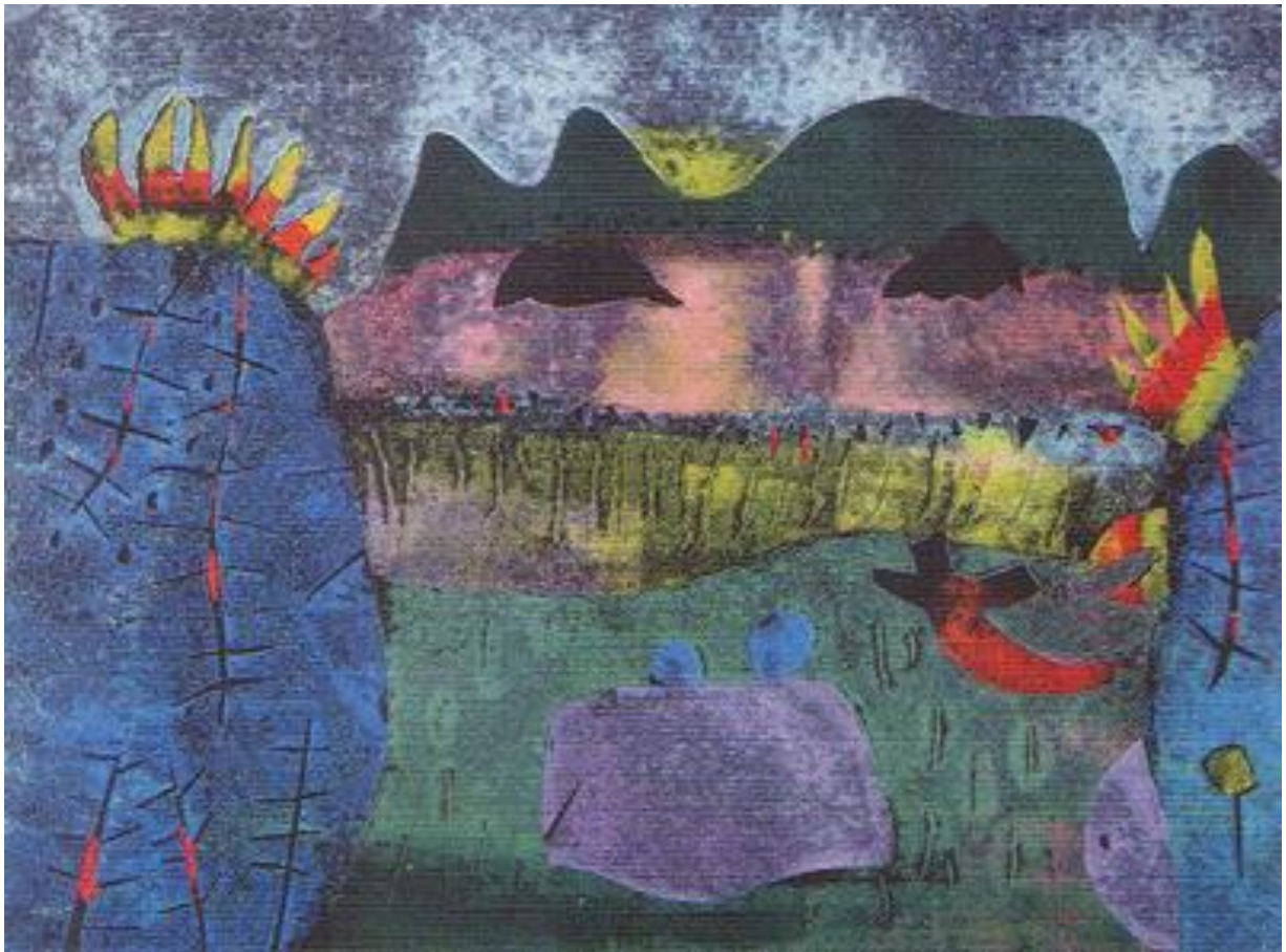
Zrození kamene, 1969