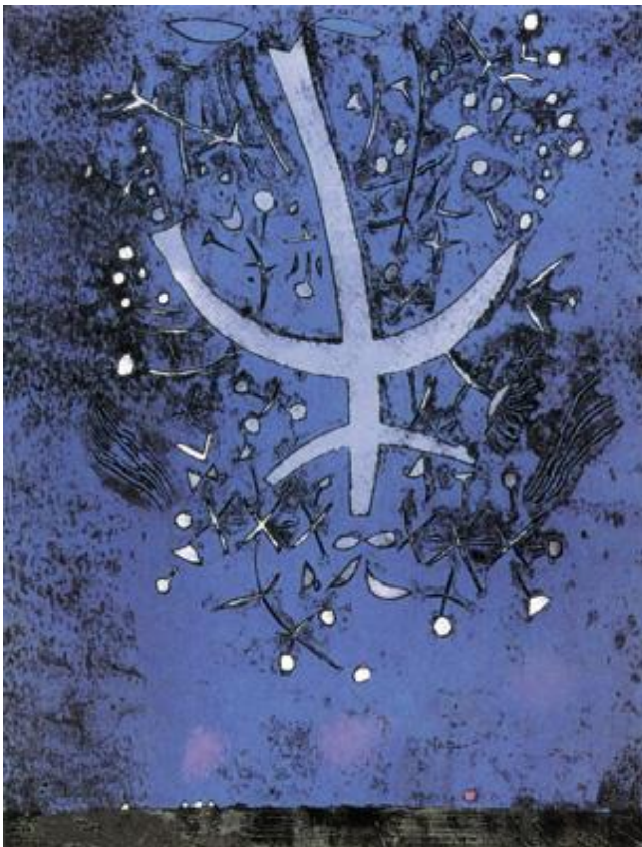
Nebeský lustr, 1971