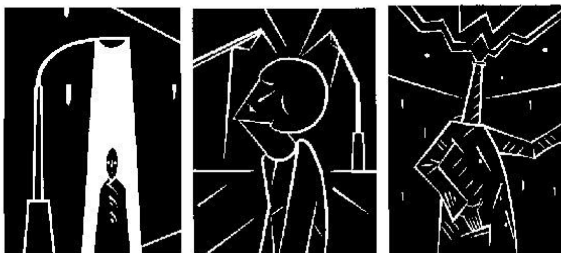
Z cyklu Černé práce