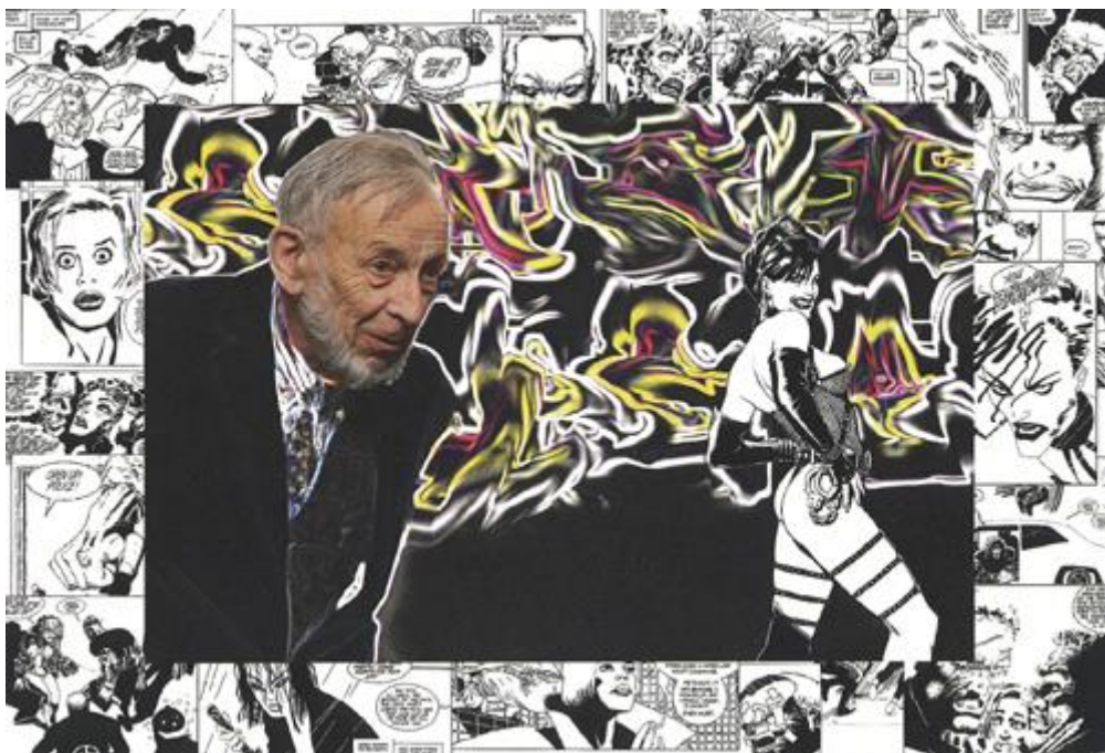
R. Škoda BÖHMEN UND MÄHREN SIN CITY (F. M.)